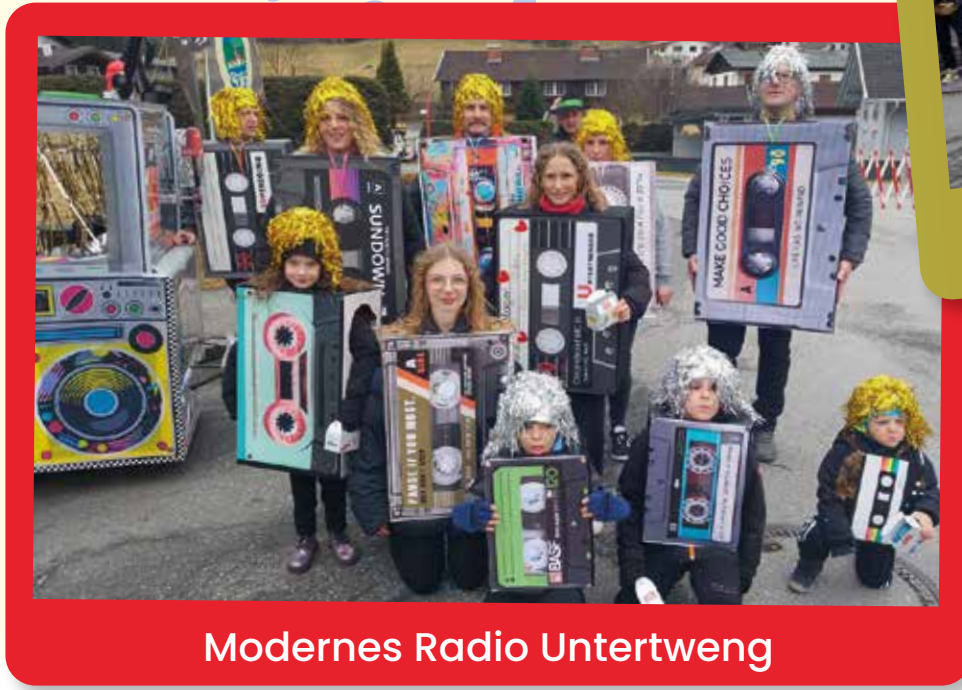
Modernes Radio Untertweg