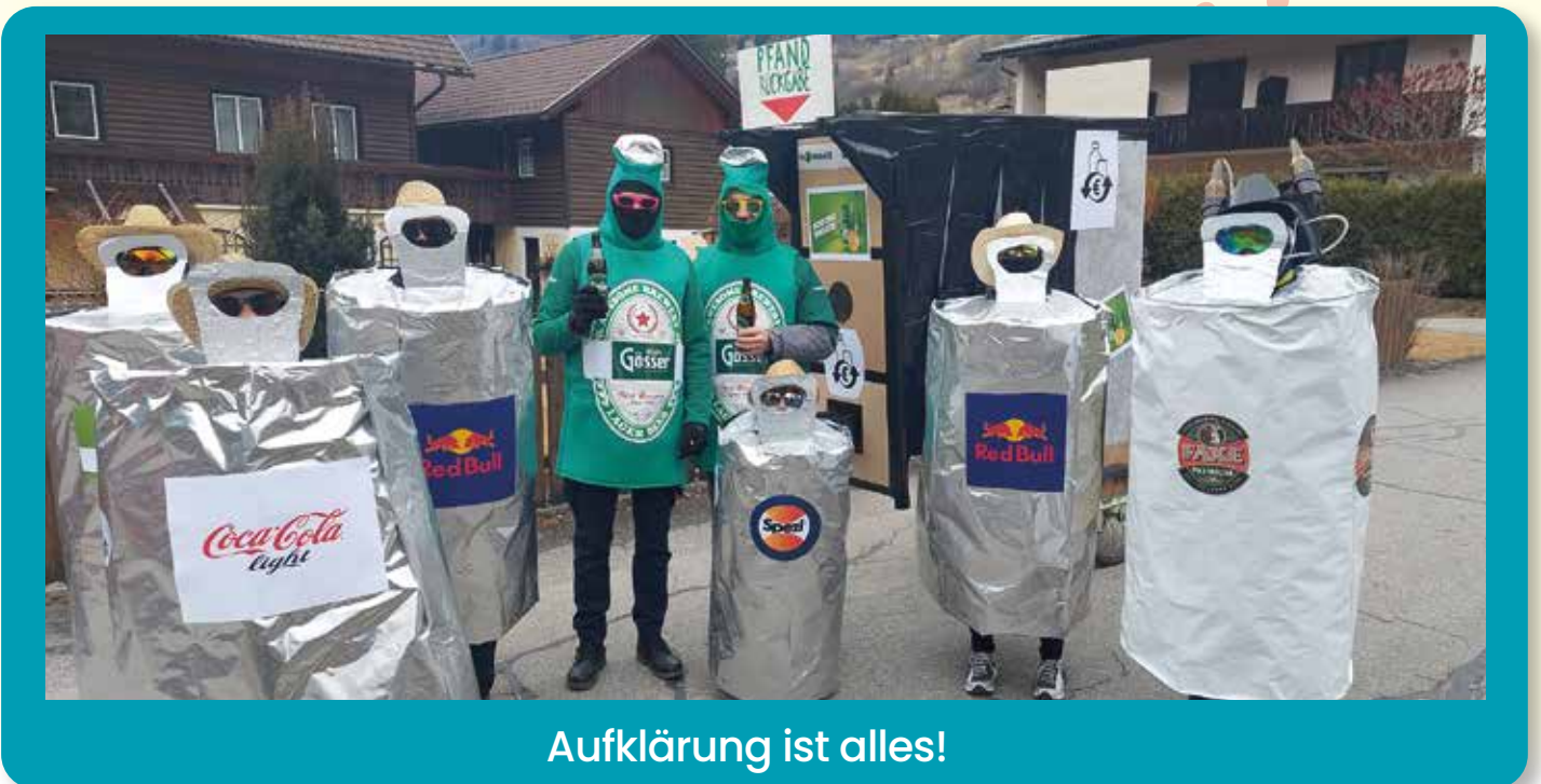
Aufklärung ist alles!