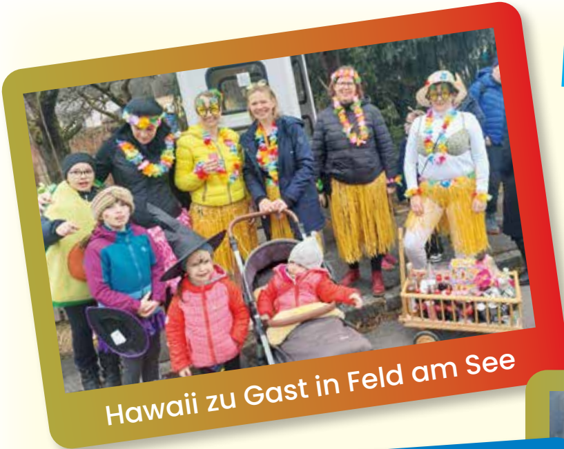
Hawaii zu Gast in Feld am See