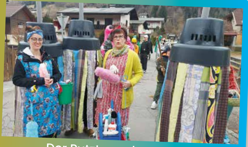
Der Putztrupp hat sofort alles sauber gemacht