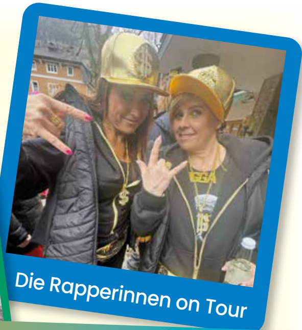
Die Rapperinnen on Tour