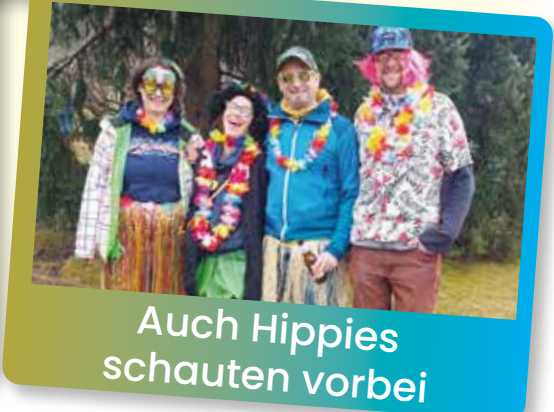
Auch Hippies schauten vorbei