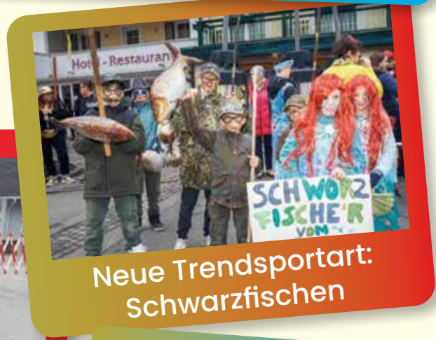
Neue Trendsportart: Schwarzfischen