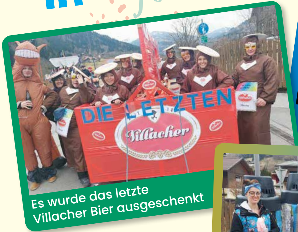
Es wurde das letzte Villacher Bier ausgeschenkt