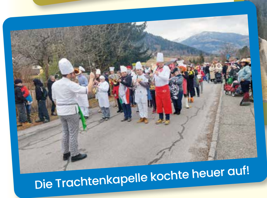
Die Trachtenkapelle kochte heuer auf!