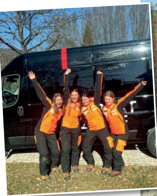
Gold im Mannschaftsbewerb!